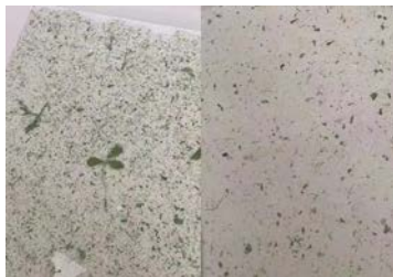
加入了苜蓿和桃花纸张

掌握造纸技巧后，在项目老师的指导下，孩子们又将天马行空的想象力融入其中，开始积极创新。与造纸一样，教育也同步进行着有益的传承和可持续发展。于是，项目老师们又开发出了再造纸张的新用途——印制版画。